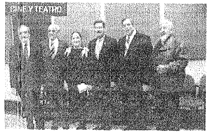
Entrega UANL Medalla al Mérito Artístico Colegia Civil...

INICIA ESCOBEDO INCUBADORA DE NEGOCIOS PARA CHAVOS